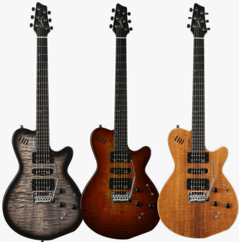
透明黑 虎纹贴面 RN 025503