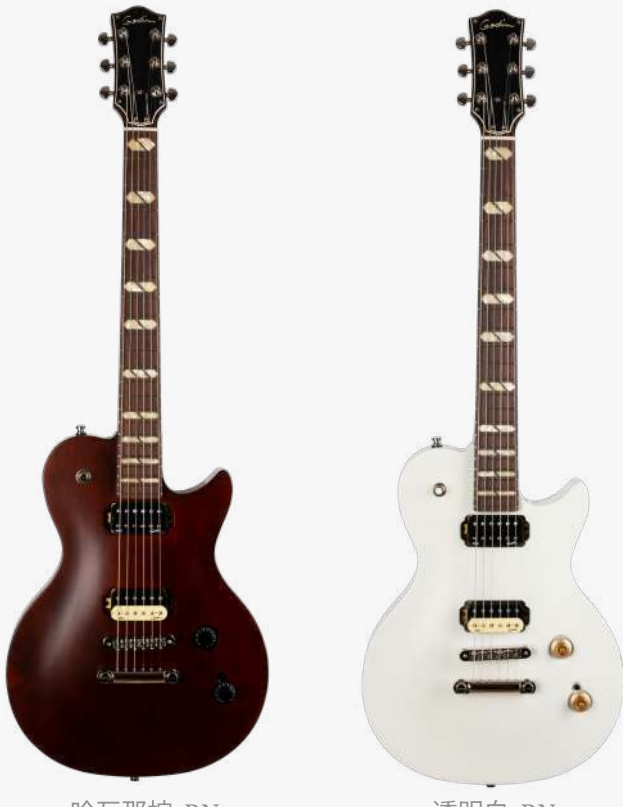
哈瓦那棕 RN 050482