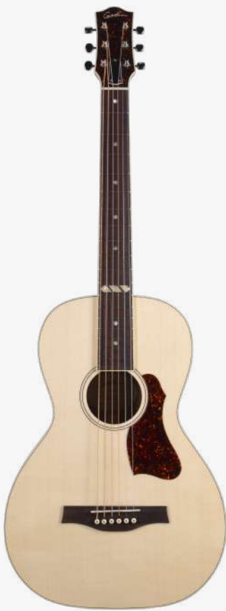
原木色 RN 051533

琴型：PARLORL 圆角 面板：单板西提卡云杉木 背板：单板桃花心木 琴颈：桃花心木 25.5 " 有效弦长 16" 指板弧度 1.72" 琴枕宽度 指板：21 品 玫瑰木指板 12 品特殊品记镶嵌 琴枕：加拿大 GRAPHTECH 漆面：面板亮光 护板：玳瑁 旋钮：16:1 电路：FISHMAN SONITONE 拾音器 控制：1 音量、1 音色 琴桥：乌木 琴弦：.012 .016 .024 .032 .042 .053 A6 LT 配件：无 产地：加拿大