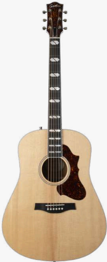
原木色 RN 051663

琴型：DREADNAUGHT 圆角、X 音梁优化 面板：经过优质压力测试的豪华单板西提卡云杉木 背侧：单板桃花心木 琴颈：桃花心木 25.5 " 有效弦长 16" 指板弧度 1.72" 琴枕宽度 指板：21 品 RICHLITE 科技乌木指板 特殊品记镶嵌 琴枕：加拿大 GRAPHTECH 漆面：亮光 护板：玳瑁 旋钮：16:1 电路：LR BAGGS ANTHEM 控制：1 压电拾音器与麦克风拾音器混合音量、 1 音量、1 电量检查、1 相位 琴桥：乌木 琴弦：.012 .016 .024 .032 .042 .053 A6 LT 配件：原厂琴包 产地：加拿大