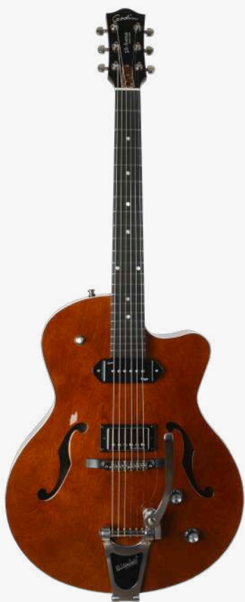
哈瓦那棕 RN 050963

琴型：单缺角设计 琴体：加拿大樱桃木面、背、侧 琴颈：加拿大银叶枫木 24.84 " 有效弦长 16" 指板弧度 1.72" 琴枕宽度 指板：21 品 RICHLITE 科技乌木指板 琴枕：加拿大 GRAPHTECH 漆面：哑光 旋钮：低音弦 18:1 高音弦 26:1 镀铬卷弦器 电路：1 X GODIN KINGPIN P90 SINGLE COIL PICKUP （琴颈） 1 X HUMBUCKER SH-1B PICKUP （琴桥） 控制：1 音量、1 音色、3 档旋钮切换 琴桥：TUNE-O-MATIC 滚珠琴桥、BIGSBY 颤音拉弦板 琴弦：.011 .014 .018 .028 .038 .049 D'ADDARIO EXL115 NICKEL WOUND 配件：无 产地：加拿大