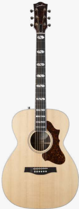
原木色 RN 051618

琴型：CONCERT HALL 圆角、X 音梁优化 面板：经过优质压力测试的豪华单板西提卡云杉木 背板：单板玫瑰木 琴颈：桃花心木 25.5 " 有效弦长 16" 指板弧度 1.72" 琴枕宽度 指板：21 品 RICHLITE 科技乌木指板 特殊品记镶嵌 琴枕：加拿大 GRAPHTECH 漆面：面板亮光 护板：玳瑁 旋钮：16:1 电路：LR BAGGS ANTHEM 控制：1 压电拾音器与麦克风拾音器混合音量、 1 音量、1 电量检查、1 相位 琴桥：乌木 琴弦：.012 .016 .024 .032 .042 .053 A6 LT 配件：原厂琴包 产地：加拿大