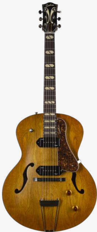
掘金色 RN 051519