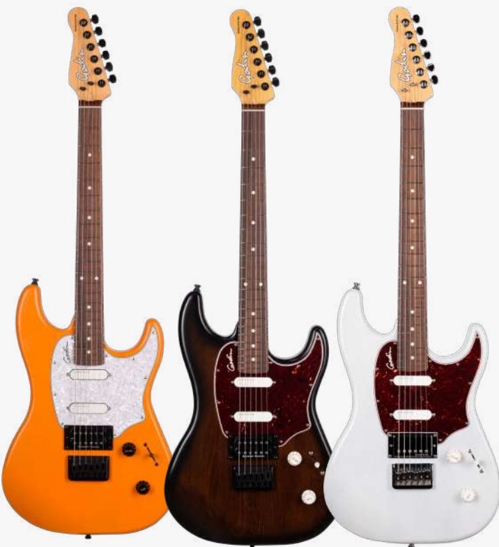
复古橙 RN 051243