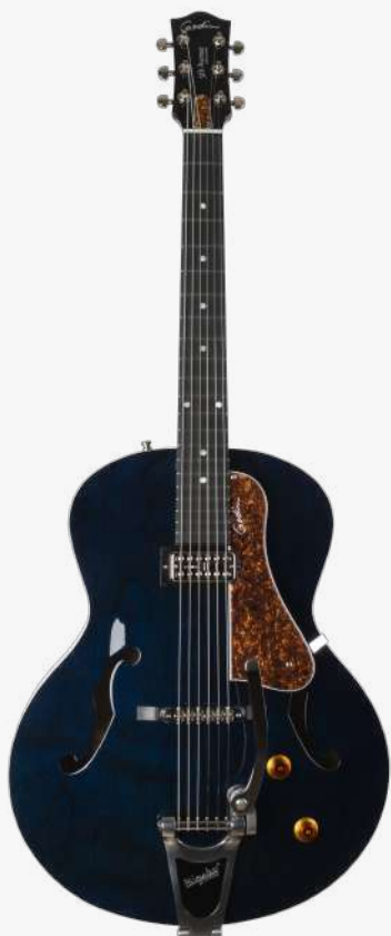
暗夜蓝 RN 050956

琴型：圆角设计 琴体：加拿大樱桃木面、背、侧 琴颈：加拿大银叶枫木 24.84" 有效弦长 16" 指板弧度 1.72" 琴枕宽度 指板：21 品 RICHLITE 科技乌木指板 琴枕：加拿大 GRAPHTECH 漆面：亮光 旋钮：低音弦 18:1 高音弦 26:1 镀铬卷弦器 电路：1 X TV JONES CLASSIC（琴颈） 控制：1 音量、1 档音色切换 琴桥：TUNE-O-MATIC 滚珠琴桥、BIGSBY 颤音拉弦板 琴弦：.011 .014 .018 .028 .038 .049 D'ADDARIO EXL115 NICKEL WOUND 配件：无 产地：加拿大