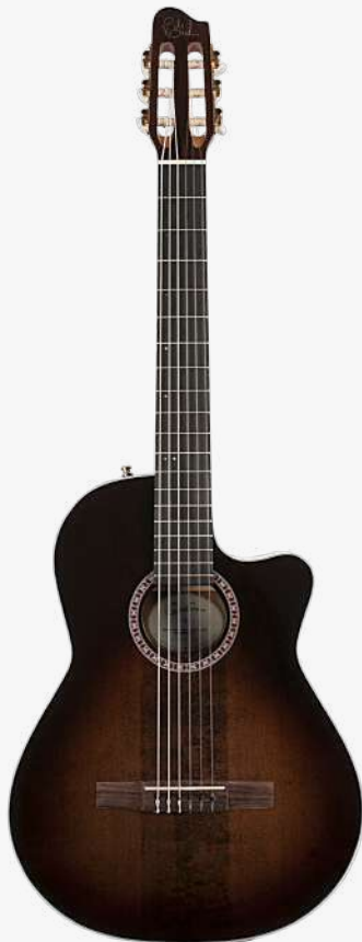
威士忌渐变 电箱 RN 051229

面板：单板云杉木 背板：单板桃花芯 琴颈：桃花心木 25.66 " 有效弦长 24" 指板弧度 2" 琴枕宽度 指板：19 品 RICHLITE 科技乌木指板 琴枕：加拿大 GRAPHTECH 漆面：亮光 旋钮：14:1 电路：LR BAGGS ELEMENT 控制：1 音量、1 音色，双源均衡器。 琴桥：玫瑰木 琴弦：.0285 .0327 .0410 .030 .036 .044 HTC NYLON 配件：无 产地：加拿大