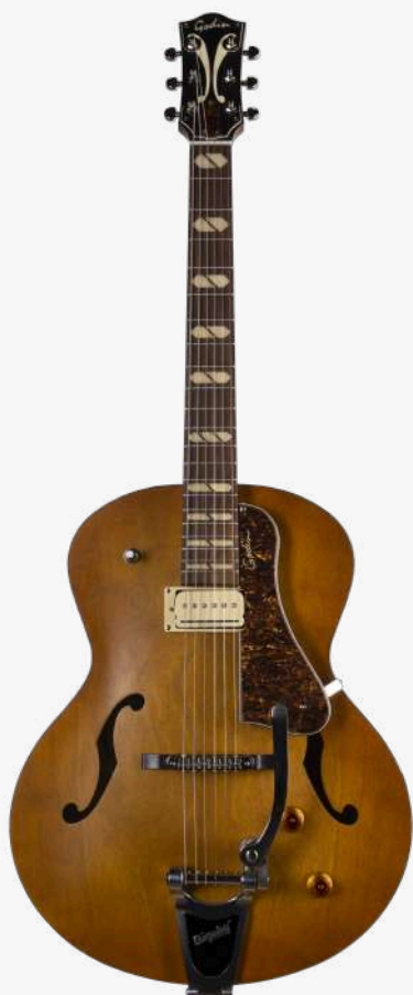
掘金色 RN 051502