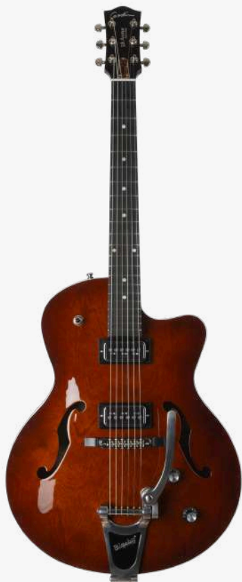
哈瓦那渐变 RN 050970

琴型：单缺角设计 琴体：加拿大樱桃木面、背、侧 琴颈：加拿大银叶枫木 24.84" 有效弦长 16" 指板弧度 1.72" 琴枕宽度 指板：21 品 RICHLITE 科技乌木指板 琴枕：加拿大 GRAPHTECH 漆面：面板亮光 旋钮：低音弦 18:1 高音弦 26:1 镀铬卷弦器 电路：2 X T-ARMOND BY TV JONES（琴颈、琴桥） 控制：1 音量、1 音色、3 档旋钮切换 琴桥：TUNE-O-MATIC 滚珠琴桥、BIGSBY 颤音拉弦板 琴弦：.011 .014 .018 .028 .038 .049 D'ADDARIO EXL115 NICKEL WOUND 配件：无 产地：加拿大