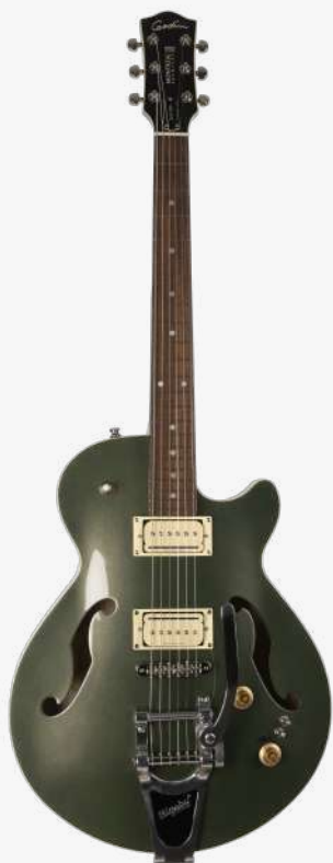
沙漠绿 RN 051588

琴型：单缺角设计 琴体：拱面开放气孔雪松木 背侧：加拿大樱桃木面板 琴颈：桃花心 24.75" 有效弦长 12" 指板弧度 1.68" 琴枕宽度 指板：22 品 玫瑰木 / 赛璐璐品记镶嵌 琴枕：加拿大 GRAPHTECH 漆面：亮光 旋钮：低音弦 18:1 高音弦 26:1 镀铬卷弦器 电路：2 X SEYMOUR DUNCAN P-RAIL™（琴颈、琴桥） 控制：1 音色、1 音量、3 档控制、2 迷你拨档 琴桥：BIGSBY 颤音系统、滚珠琴桥 琴弦：.010 .013 .017 .026 .036 .046 E10 配件：原厂琴包 产地：加拿大