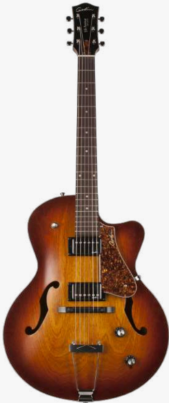
白兰地渐变 RN 050932

琴型：单缺角设计 琴体：加拿大樱桃木面、背、侧 琴颈：加拿大银叶枫木 24.84 " 有效弦长 16" 指板弧度 1.72" 琴枕宽度 指板：21 品 玫瑰木 琴枕：加拿大 GRAPHTECH 漆面：19 世纪法式哑光漆面 护板：悬浮护板 旋钮：低音弦 18:1 高音弦 26:1 镀铬卷弦器 电路：2 X CUSTOM GODIN HUMBUCKER （琴颈、琴桥） 控制：1 音量、1 音色、三挡旋钮切换 琴桥：加拿大 GRAPHTECH 可调节式 TUSQ 琴桥 琴弦：.012 .016 .024W .032 .042 .052 E12 JAZZ 配件：无 产地：加拿大