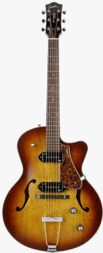
白兰地渐变 RN 050987

琴型：单缺角设计 琴体：加拿大樱桃木面、背、侧 琴颈：加拿大银叶枫木 24.84 " 有效弦长 16" 指板弧度 1.72" 琴枕宽度 指板：21 品 玫瑰木 琴枕：加拿大 GRAPHTECH 漆面：19 世纪法式哑光漆面 护板：悬浮护板 旋钮：低音弦 18:1 高音弦 26:1 镀铬卷弦器 电路：2 X GODIN KINGPIN P90 SINGLE COIL （琴颈、琴桥） 控制：1 音量、1 音色、三挡旋钮切换 琴桥：加拿大 GRAPHTECH 可调节式 TUSQ 琴桥 琴弦：.012 .016 .024W .032 .042 .052 E12 JAZZ 配件：无 产地：加拿大