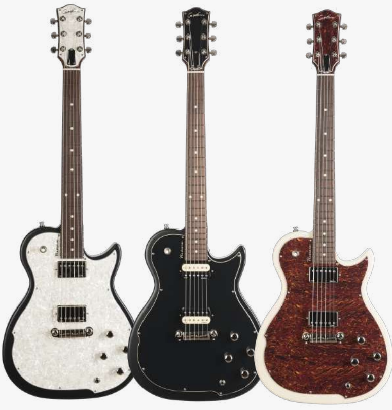
波旁渐变 RN 048465