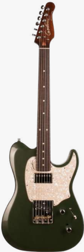
沙漠绿 RN 046959

琴体：加拿大劳伦森椴木 琴颈：硬枫木 25.5" 有效弦长 12" 指板弧度 1.65" 琴枕宽度 护板：五层冰花护板或玳瑁护板 指板：22 品 玫瑰木 琴枕：加拿大 GRAPHTECH 漆面：亮光 旋钮：18:1 电路：1 X SEYMOUR DUNCAN '59 双线圈拾音器（琴颈） 1 X GODIN CUSTOM CAJUN 单线圈拾音器（琴桥） 控制：1 音量、1 音色、5 档控制 1 X GODIN HDR 高解析度降噪系统 琴桥：CUSTOM T 可调节八度复古琴桥、黄铜琴鞍 琴弦：.010 .013 .017 .026 .036 .046 E10 配件：原厂琴包 产地：加拿大