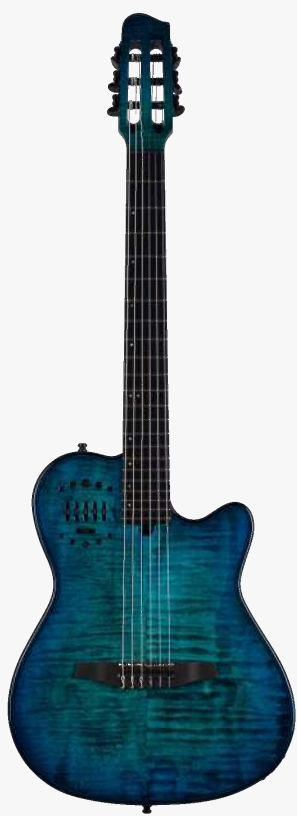
海洋蓝 LTD 053391

琴体：实心雪松面板配高级花纹枫木贴面 面板：单板云杉面板 琴颈：加拿大银叶枫木 25.5" 有效弦长 16" 指板弧度 1.9" 琴枕宽度 指板：22 品 RICHLITE 科技乌木指板 琴枕：加拿大 GRAPHTECH 漆面：亮光 旋钮：16:1 电路：GODIN & LR BAGGS 深度定制的豪华拾音器系统，六个独立黄铜琴码压电拾音器，可与支持打板的 LYRIC 麦克风拾音器混合。可调节的带磁饱和，以及模拟与相位控制，灵敏捕捉每一根琴弦的微妙细节，可一键消除啸叫。 控制：拾音器前级控制位于面板之上，调节十分便捷。 琴桥：RICHLITE 科技乌木 琴弦：.0285 .0327 .0410 .030 .036 .044 HTC NYLON 配件：原厂琴包 产地：加拿大