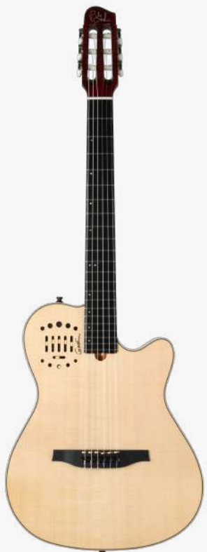
原木色 RN 050925

琴体：双腔体精选桃花心木（上下双层共鸣腔体） 面板：单板云杉面板 琴颈：桃花心木 25.5" 有效弦长 16" 指板弧度 1.9" 琴枕宽度 指板：22 品 RICHLITE 科技乌木指板 琴枕：加拿大 GRAPHTECH 漆面：亮光 旋钮：16:1 电路：GODIN & LR BAGGS 深度定制的豪华 拾音器系统，六个独立黄铜琴码压 电拾音器，可与支持打板的 LYRIC 麦克风拾音器混合。可调节的带磁饱和， 以及模拟与相位控制，灵敏捕捉每一根 琴弦的微妙细节，可一键消除啸叫。 控制：拾音器前级控制位于面板之上，调节十分便捷。 琴桥：RICHLITE 科技乌木 琴弦：.0285 .0327 .0410 .030 .036 .044 HTC NYLON 配件：原厂琴包 产地：加拿大