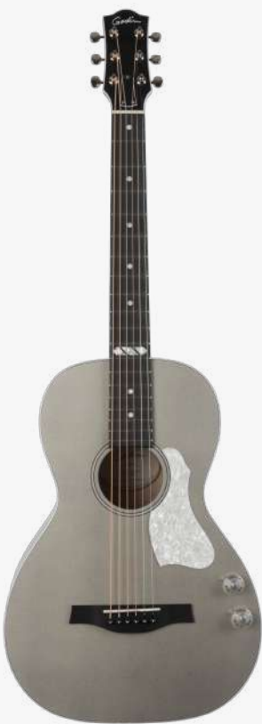
绸缎灰 RN 047956

琴型：PARLORL 圆角 面板：单板西提卡云杉木 背侧：单板加拿大樱桃木 琴颈：银叶枫木 25.5 " 有效弦长 16" 指板弧度 1.72" 琴枕宽度 指板：21 品 RICHLITE 科技乌木指板 12 品特殊品记镶嵌 琴枕：加拿大 GRAPHTECH 漆面：亮光 护板：冰花 旋钮：16:1 电路：EPM Q-DISCRETE 拾音器 控制：1 音量、1 音色 琴桥：乌木 琴弦：.012 .016 .024 .032 .042 .053 A6 LT 配件：原厂琴包 产地：加拿大