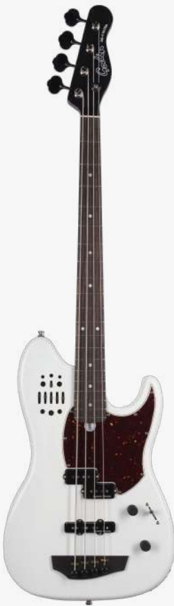
透明白 RN 050420

贴面：银叶枫木 琴体：带腔体加拿大劳伦森椴木 琴颈：硬石枫木 34" 有效弦长 12" 指板弧度 1.5" 琴枕宽度 指板：20 品 玫瑰木 琴枕：加拿大 GRAPHTECH 漆面：哑光 护板：5 层玳瑁护板 旋钮：20:1 电路：1 X SEYMOUR DUNCAN VINTAGE P-BASS（中间） 1 X SEYMOUR DUNCAN APOLLO J-BASS（琴桥） 1 X HEX ACOUSTIC SADDLES CUSTOM VOICED LR BAGGS 前级 可混合音量、模拟磁饱和度音色调节、 FAT 控制，高音、中音、低音调节。 控制：1 音量、1 音色、4 档控制 琴桥：乌木 琴弦：.045 .065 .085 .105 D'ADDARIO EXL165 SUPER LONG SCALE 配件：原厂琴包 产地：加拿大