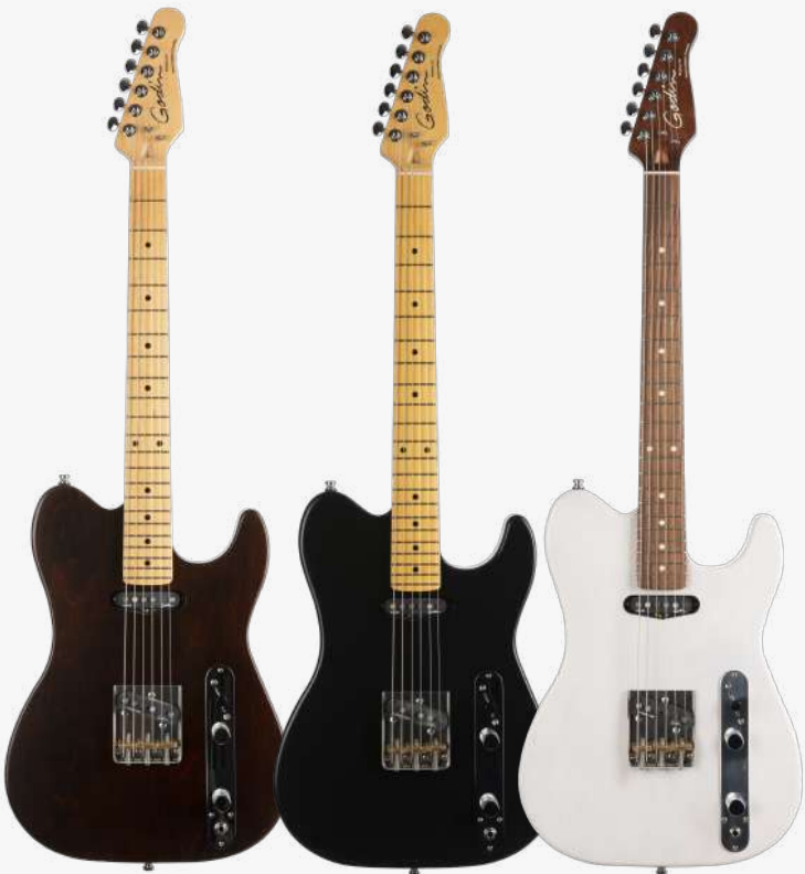
哈瓦那棕 MN 049325