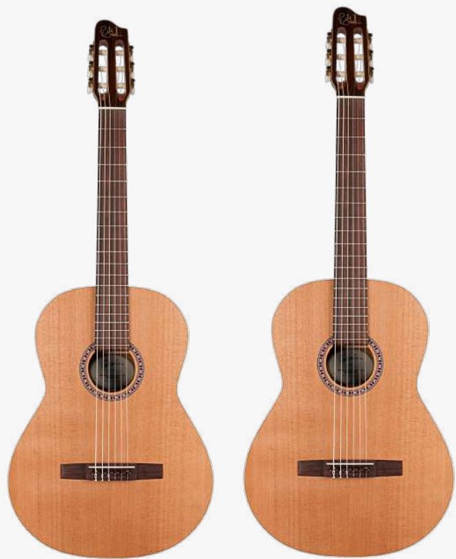
原木色 RN 049646