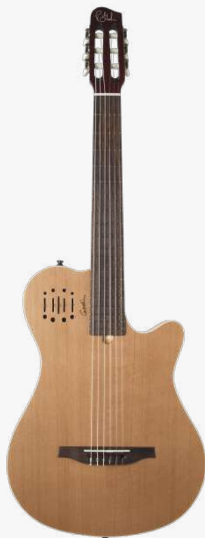
原木色 RN 041756

琴体：双腔体加拿大银叶枫木（上下双层共鸣腔体） 面板：单板雪松面板 琴颈：桃花心木 25.6" 有效弦长 24" 指板弧度 2" 琴枕宽度 指板：19 品 玫瑰木 琴枕：加拿大 GRAPHTECH 漆面：哑光 旋钮：16:1 电路：由 GODIN 自主研发的双拾音器系统， 两个琴体传感器，以及压电琴桥拾音器。 控制：拾音器前级控制位于面板之上，调节十分便捷。 琴桥：玫瑰木 琴弦：.0285 .0327 .0410 .030 .036 .044 HTC NYLON 配件：原厂琴包 产地：加拿大