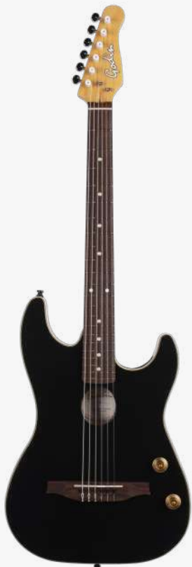
哑光黑 RN 051458

琴体：腔体加拿大银叶枫木 贴面：单板雪松面板 琴颈：硬石枫木 25.5" 有效弦长 12" 指板弧度 1.65" 琴枕宽度 指板：22 品 玫瑰木 中号品丝 琴枕：加拿大 GRAPHTECH 漆面：哑光 旋钮：14:1 电路：1 X EPM Q-DISCRETE 压电拾音器 控制：1 音量、1 音色 琴桥：玫瑰木 琴弦：.029 .0333 .0416 .030 .036 .045 XHTC 配件：原厂琴包 产地：加拿大