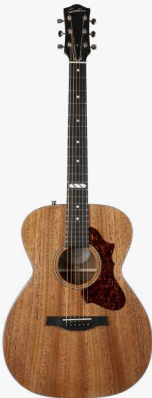
原木色 RN 050130

琴型：CONCERT HALL 圆角 面板：面板与背板使用单板桃花心木 背侧：桃花心木 琴颈：桃花心木 25.5 " 有效弦长 16" 指板弧度 1.72" 琴枕宽度 指板：21 品 RICHLITE 科技乌木指板 12 品特殊品记镶嵌 琴枕：加拿大 GRAPHTECH 漆面：哑光 护板：玳瑁 旋钮：16:1 电路：LR BAGGS ELEMENT 压电拾音器 控制：1 静音、1 音量、1 音色 琴桥：乌木 琴弦：.012 .016 .024 .032 .042 .053 A6 LT 配件：无 产地：加拿大