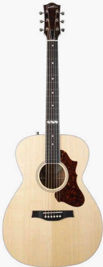
原木色 RN 051625

琴型：CONCERT HALL 圆角、X 音梁优化 面板：经过优质压力测试的豪华单板西提卡云杉木 背板：单板桃花心木 琴颈：桃花心木 25.5 " 有效弦长 16" 指板弧度 1.72" 琴枕宽度 指板：21 品 RICHLITE 科技乌木指板 12 品特殊品记镶嵌 琴枕：加拿大 GRAPHTECH 漆面：亮光 护板：玳瑁 旋钮：16:1 电路：LR BAGGS ANTHEM 控制：1 压电拾音器与麦克风拾音器混合音量、 1 音量、1 电量检查、1 相位 琴桥：乌木 琴弦：.012 .016 .024 .032 .042 .053 A6 LT 配件：原厂琴包 产地：加拿大