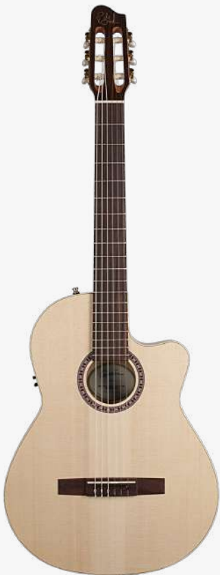
原木色 电箱 RN 051793

面板：单板云杉木 背板：加拿大樱桃木 琴颈：桃花心木 25.66 " 有效弦长 24" 指板弧度 2" 琴枕宽度 指板：19 品 玫瑰木 琴枕：加拿大 GRAPHTECH 漆面：哑光 旋钮：14:1 电路：FISHMAN CLASICA II 控制：1 音量、1 音色 琴桥：玫瑰木 琴弦：.0285 .0327 .0410 .030 .036 .044 HTC NYLON 配件：无 产地：加拿大