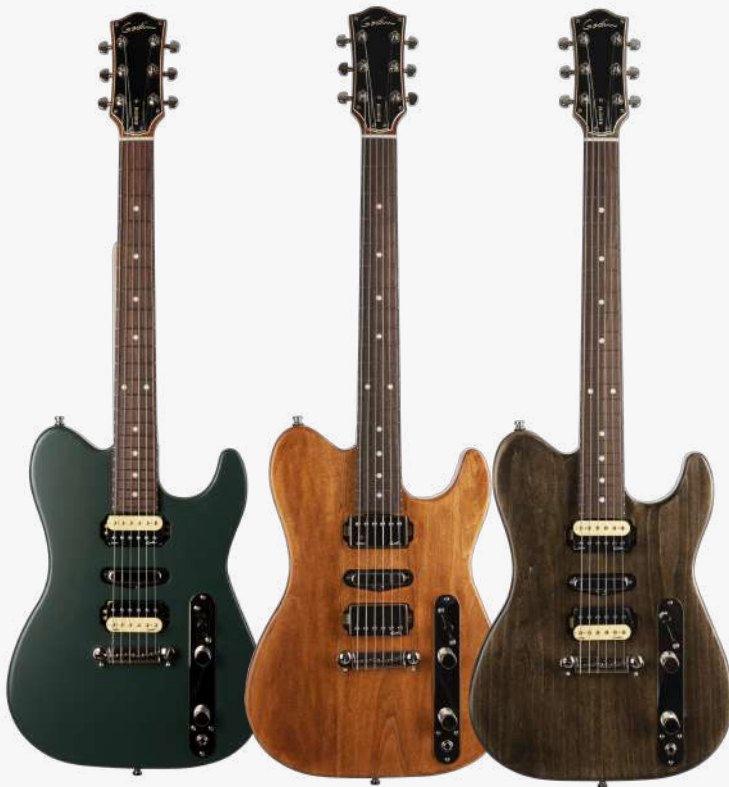
哑光绿 RN 050406