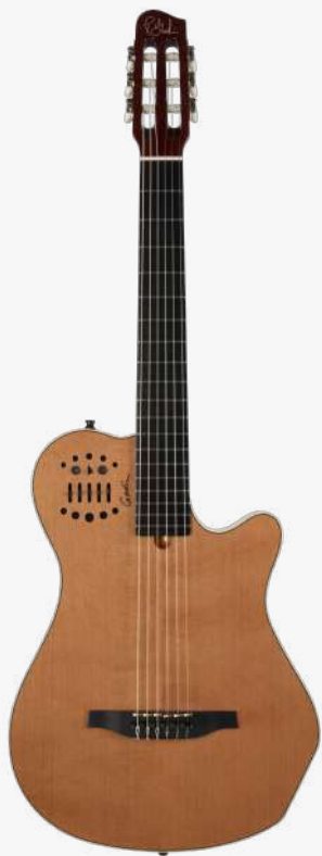
原木色 RN 012817

琴体：双腔体加拿大银叶枫木（上下双层共鸣腔体） 面板：单板雪松面板 琴颈：桃花心木 25.6" 有效弦长 24" 指板弧度 2" 琴枕宽度 指板：19 品 RICHLITE 科技乌木指板 琴枕：加拿大 GRAPHTECH 漆面：亮光 旋钮：16:1 电路：GODIN & LR BAGGS 深度定制的豪华拾音器系统， 六个独立黄铜琴码压电拾音器。 13 针接口用于 ROLAND GR 合成器和大多数 13 针 MIDI 设备，可让吉他发出其他乐器的音色。 控制：拾音器前级控制位于面板之上，调节十分便捷。 琴桥：RICHLITE 科技乌木 琴弦：.0285 .0327 .0410 .030 .036 .044 HTC NYLON 配件：原厂琴包 产地：加拿大