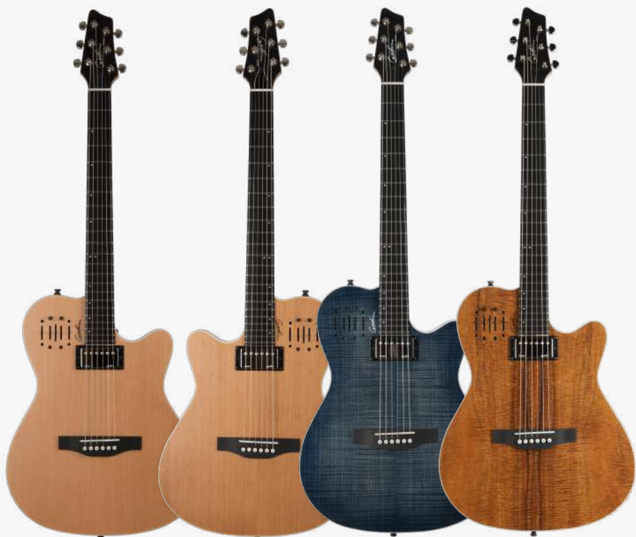
原木色 RN 030293 原木色 左手 RN 036752 牛仔蓝 RN 047963 相思木 RN 038206

琴体：双腔体加拿大银叶枫木 面板：单板雪松面板/单板夏威夷相思木面板 琴颈：桃花心木 25.5" 有效弦长 16" 指板弧度 1.72" 琴枕宽度 指板：22 品 RICHLITE 科技乌木指板 琴枕：加拿大 GRAPHTECH 漆面：哑光 旋钮：低音弦 18:1 高音弦 26:1 镀铬卷弦器 电路：1 X CUSTOM GODIN HUMBUCKER 1 X GODIN 压电拾音器 兼顾电吉他和原声吉他音色 2 种输出(电声、原声/混合) 控制：拾音器前级控制位于面板之上， 调节十分便捷。 琴桥：RICHLITE 科技乌木 琴弦：.012 .016 .024W .032 .042 .052 E12 JAZZ 配件：原厂琴包 产地：加拿大