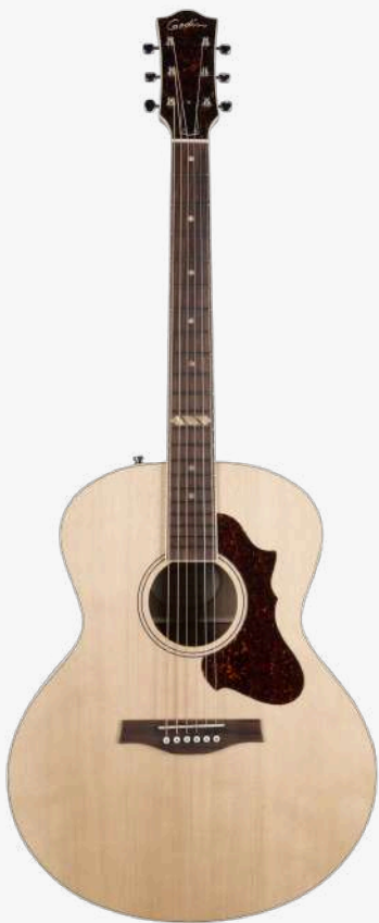
原木色 RN 052110

琴型：MINI JUMBO 圆角 面板：单板西提卡云杉木 背板：单板桃花心木 琴颈：桃花心木 25.5 " 有效弦长 16" 指板弧度 1.72" 琴枕宽度 指板：21 品 玫瑰木指板 12 品特殊品记镶嵌 琴枕：加拿大 GRAPHTECH 漆面：面板亮光 护板：玳瑁 旋钮：16:1 电路：FISHMAN SONITONE 拾音器 控制：1 音量、1 音色 琴桥：玫瑰木 琴弦：.012 .016 .024 .032 .042 .053 A6 LT 配件：无 产地：加拿大