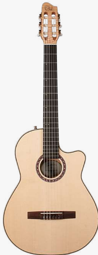
原木色 电箱 RN 051212

面板：单板云杉木 背板：单板虎纹枫木 琴颈：桃花心木 25.66 " 有效弦长 24" 指板弧度 2" 琴枕宽度 指板：19 品 RICHLITE 科技乌木指板 琴枕：加拿大 GRAPHTECH 漆面：亮光 旋钮：14:1 电路：LR BAGGS ELEMENT 控制：1 音量、1 音色 琴桥：玫瑰木 琴弦：.0285 .0327 .0410 .030 .036 .044 HTC NYLON 配件：无 产地：加拿大