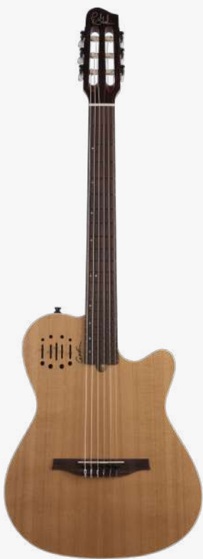
原木色 RN 035045