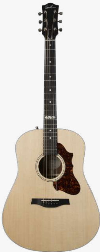
原木色 RN 051649

琴型：DREADNAUGHT 圆角 面板：单板西提卡云杉木 背侧：单板桃花心木 琴颈：桃花心木 25.5 " 有效弦长 16" 指板弧度 1.72" 琴枕宽度 指板：21 品 RICHLITE 科技乌木指板 12 品特殊品记镶嵌 琴枕：加拿大 GRAPHTECH 漆面：哑光 护板：玳瑁 旋钮：16:1 电路：LR BAGGS ELEMENT 压电拾音器 控制：1 音孔静音、1 音量、1 音色 琴桥：乌木 琴弦：.012 .016 .024 .032 .042 .053 A6 LT 配件：原厂琴包 产地：加拿大