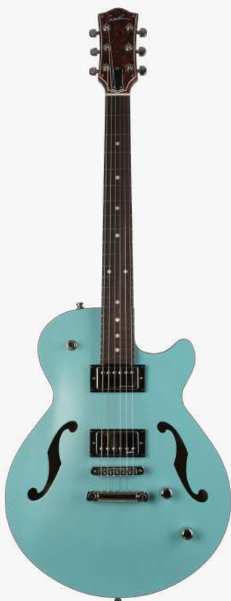
海湾蓝 RN 050215