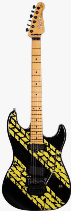
黑黄 MN 51199

琴体：加拿大银叶枫木拼白杨木琴翼 琴颈：硬石枫木 24.75" 有效弦长 12" 指板弧度 1.65" 琴枕宽度 指板：22 品 枫木 中号品丝 琴枕：FLOYD ROSE LOCKING NUT 带锁 漆面：亮光 旋钮：低音弦 18:1 高音弦 26:1 镀铬卷弦器 电路：1 X EMG SLV（琴颈） 1 X SLANTED EMG 85（琴桥） 控制：1 音量、3 档旋钮控制 琴桥：1 X FLOYD ROSE ORIGINAL（琴桥） 琴弦：.010 .013 .017 .026 .036 .046 E10 配件：无 产地：加拿大