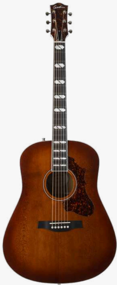
哈瓦那渐变 RN 051656

琴型：DREADNAUGHT 圆角、X 音梁优化 面板：经过优质压力测试的豪华单板雪松木 背侧：单板桃花心木 琴颈：桃花心木 25.5 " 有效弦长 16" 指板弧度 1.72" 琴枕宽度 指板：21 品 RICHLITE 科技乌木指板 特殊品记镶嵌 琴枕：加拿大 GRAPHTECH 漆面：亮光 护板：玳瑁 旋钮：16:1 电路：LR BAGGS ANTHEM 控制：1 压电拾音器与麦克风拾音器混合音量、 1 音量、1 电量检查、1 相位 琴桥：乌木 琴弦：.012 .016 .024 .032 .042 .053 A6 LT 配件：原厂琴包 产地：加拿大