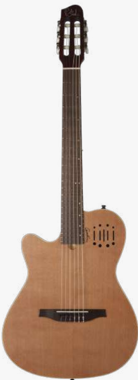
原木色 左手 RN 035878

琴体：双腔体加拿大银叶枫木拼加拿大劳伦森椴木两翼（上下双层共鸣腔体） 面板：单板雪松面板 琴颈：桃花心木 25.5" 有效弦长 16" 指板弧度 1.9" 琴枕宽度 指板：22 品 玫瑰木 琴枕：加拿大 GRAPHTECH 漆面：哑光 旋钮：16:1 电路：由 GODIN 自主研发的双拾音器系统，两个琴体传感器，以及压电琴桥拾音器。 控制：拾音器前级控制位于面板之上，调节十分便捷。 琴桥：玫瑰木 琴弦：.0285 .0327 .0410 .030 .036 .044 HTC NYLON 配件：原厂琴包 产地：加拿大