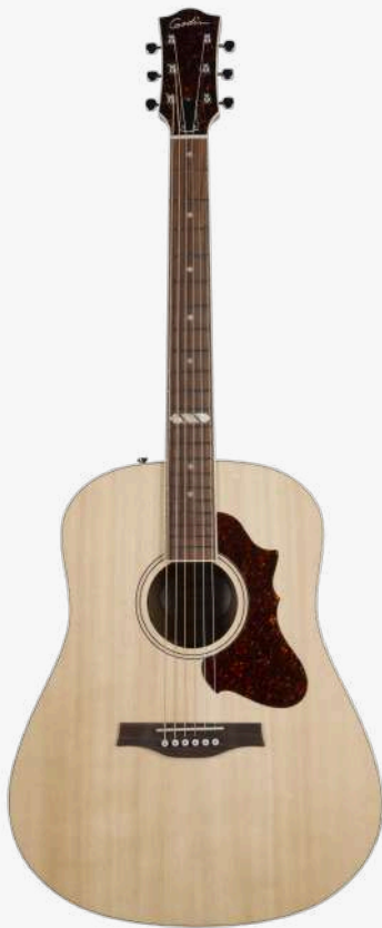
原木色 RN 051526

琴型：DREADNAUGHT 圆角 面板：单板西提卡云杉木 侧板：单板桃花心木 琴颈：桃花心木 25.5 " 有效弦长 16" 指板弧度 1.72" 琴枕宽度 指板：21 品 玫瑰木指板 12 品特殊品记镶嵌 琴枕：加拿大 GRAPHTECH 漆面：面板亮光 护板：玳瑁 旋钮：16:1 电路：FISHMAN SONITONE 拾音器 控制：1 音量、1 音色 琴桥：玫瑰木 琴弦：.012 .016 .024 .032 .042 .053 A6 LT 配件：无 产地：加拿大