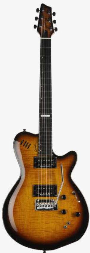
白兰地渐变 虎纹贴面 RN 024124

琴体：拱面枫木面板、银叶枫木拼杨木两翼 贴面：AAA 高级火焰枫木贴面 琴颈：桃花心木 25.5" 有效弦长 16" 指板弧度 1.72" 琴枕宽度 指板：22 品 RICHLITE 科技乌木指板 琴枕：加拿大 GRAPHTECH 漆面：亮光 旋钮：18:1 控制：1 音量、1 音色、1 合成器音量、5 档控制、 3 种输出(压电拾音器/磁性拾音器/混合) 琴桥：颤音琴桥带 LR BAGGS 压电拾音器 琴弦：.010 .013 .017 .026 .036 .046 E10 电路：1 X SEYMOUR DUNCAN JAZZ SH-2N（琴颈） 1 X SEYMOUR DUNCAN CUSTOM SH 11-P（琴桥） 1 X LR BAGGS 压电拾音器、3 段均衡、定制前级 13 针接口用于 ROLAND GR™ 合成器和大多数 13 针 MIDI 设备，可让吉他发出其他乐器的音色。 配件：原厂琴包 产地：加拿大