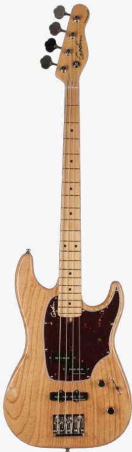
原木色 RN 041985

贴面：裁切沼泽桤木 琴体：红雪松（琴体内同步共振腔） 琴颈：硬石枫木 34" 有效弦长 12" 指板弧度 1.5" 琴枕宽度 指板：20 品 枫木 琴枕：加拿大 GRAPHTECH 漆面：亮光 护板：5 层玳瑁护板 旋钮：20:1 电路：1 X SEYMOUR DUNCAN QUARTER-POUND PJ™ 控制：1 音量、1 音色、4 档控制 琴桥：固定琴桥 琴弦：.045 .065 .085 .105 D'ADDARIO EXL165 SUPER LONG SCALE 配件：原厂琴包 产地：加拿大