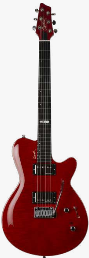
透明红 虎纹贴面 RN 047604

琴体：银叶枫木拼加拿大劳伦森椴木两翼 贴面：高级火焰枫木贴面 琴颈：桃花心木 25.5" 有效弦长 16" 指板弧度 1.68" 琴枕宽度 指板：22 品 RICHLITE 科技乌木指板 琴枕：加拿大 GRAPHTECH 漆面：亮光 旋钮：低音弦 18:1 高音弦 26:1 镀铬卷弦器 电路：1 X SEYMOUR DUNCAN JAZZ SH-2N（琴颈） 1 X SEYMOUR DUNCAN CUSTOM SH 11-P（琴桥） 控制：1 音量、1 音色、1 GODIN HDR 高解析度降噪系统、5 档控制 琴桥：GODIN TRU-LOC TREM 颤音系统、黄铜琴鞍 琴弦：.010 .013 .017 .026 .036 .046 E10 配件：原厂琴包 产地：加拿大