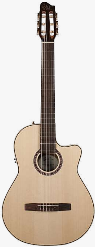
原木色 电箱 RN 051809

面板：单板云杉木 背板：单板桃花心木 琴颈：桃花心木 25.66 " 有效弦长 24" 指板弧度 2" 琴枕宽度 指板：19 品 玫瑰木 琴枕：加拿大 GRAPHTECH 漆面：亮光 旋钮：14:1 电路：FISHMAN CLASICA II 控制：1 音量、1 音色 琴桥：玫瑰木 琴弦：.0285 .0327 .0410 .030 .036 .044 HTC NYLON 配件：无 产地：加拿大