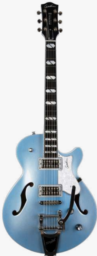
帝王蓝 RN 051595

琴型：单缺角设计 琴体：拱面开放气孔雪松木 背侧：加拿大樱桃木面板 琴颈：桃花心 24.75" 有效弦长 12" 指板弧度 1.68" 琴枕宽度 指板：22 品 RICHLITE 科技乌木指板 / 赛璐璐品记镶嵌 琴枕：加拿大 GRAPHTECH 漆面：亮光 旋钮：低音弦 18:1 高音弦 26:1 镀铬卷弦器 电路：1 X TV JONES CLASSIC（琴颈） 控制：1 音色、1 音量、3 档控制 琴桥：1 X TV JONES CLASSIS PLUS（琴桥） 琴弦：.010 .013 .017 .026 .036 .046 E10 配件：原厂琴包 产地：加拿大