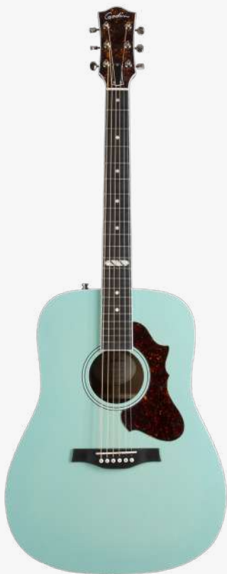
湖水蓝 RN 051632

琴型：DREADNAUGHT 圆角 面板：单板西提卡云杉木 背侧：单板桃花心木 琴颈：桃花心木 25.5 " 有效弦长 16" 指板弧度 1.72" 琴枕宽度 指板：21 品 RICHLITE 科技乌木指板 12 品特殊品记镶嵌 琴枕：加拿大 GRAPHTECH 漆面：亮光 护板：玳瑁 旋钮：低音弦 18:1 高音弦 26:1 镀铬卷弦器 电路：LR BAGGS ANTHEM 控制：1 压电拾音器与麦克风拾音器混合音量、 1 音量、1 电量检查、1 相位 琴桥：乌木 琴弦：.012 .016 .024 .032 .042 .053 A6 LT 配件：原厂琴包 产地：加拿大