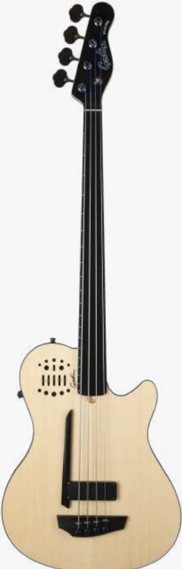
原木色 RN 050796

琴体：银叶枫木拼加拿大劳伦森椴木两翼 面板：单板云杉木 琴颈：硬石枫木 34" 有效弦长 12" 指板弧度 1.5" 琴枕宽度 （五弦为 16" 指板弧度、1.82" 琴枕宽度） 指板：无品 RICHLITE 科技乌木指板 琴枕：加拿大 GRAPHTECH 漆面：哑光 旋钮：20:1 电路：1 X LACE™ SENSOR LOW-PROFILE（琴桥） 1 X 定制的 LR BAGGS 拾音系统 可混合音量、模拟磁饱和度音色调节。 控制：双输出，电声、原声/混合， 拾音器前级控制位于面板之上，调节十分便捷。 琴桥：乌木 琴弦：.045 .065 .085 .105 D'ADDARIO EXL165 SUPER LONG SCALE（五弦 .045 .065 .080 .100 .132） 配件：原厂琴包 产地：加拿大