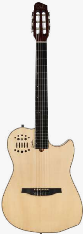
原木色 RN 004690

琴体：双腔体精选桃花心木（上下双层共鸣腔体） 面板：单板云杉面板 琴颈：桃花心木 25.5" 有效弦长 16" 指板弧度 1.9" 琴枕宽度 指板：22 品 RICHLITE 科技乌木指板 琴枕：加拿大 GRAPHTECH 漆面：亮光 旋钮：16:1 电路：GODIN & LR BAGGS 深度定制的豪华拾音器系统，六个独立黄铜琴码压电拾音器。 13 针接口用于 ROLAND GR™ 合成器和大多数 13 针 MIDI 设备，可让吉他发出其他乐器的音色。 控制：拾音器前级控制位于面板之上，调节十分便捷。 琴桥：RICHLITE 科技乌木 琴弦：.0285 .0327 .0410 .030 .036 .044 HTC NYLON 配件：原厂琴包 产地：加拿大