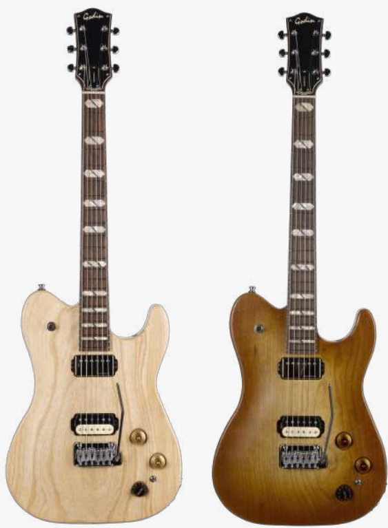
原木色 RN 051489