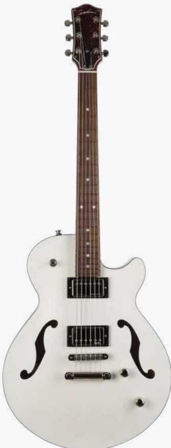
透明白 RN 050222

琴型：单缺角设计 琴体：加拿大樱桃木 背侧：加拿大樱桃木 琴颈：桃花心 24.75" 有效弦长 12" 指板弧度 1.68" 琴枕宽度 指板：22 品 玫瑰木 琴枕：加拿大 GRAPHTECH 漆面：哑光 旋钮：低音弦 18:1 高音弦 26:1 镀铬卷弦器 电路：1 X SEYMOUR DUNCAN JAZZ SH-N（琴颈） 1 X GODIN CUSTOM HUMBUCKER（琴桥） 控制：1 音色、1 音量、3 档控制 琴桥：GRAPHTECH RESOMAX 琴桥与拉弦板 琴弦：.010 .013 .017 .026 .036 .046 A10 配件：原厂琴包 产地：加拿大