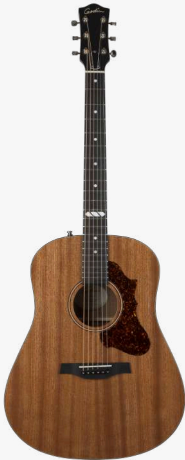
原木色 RN 050147

琴型：DREADNAUGHT 圆角 面板：面板与背板使用单板桃花心木 侧板：桃花心木 琴颈：桃花心木 25.5 " 有效弦长 16" 指板弧度 1.72" 琴枕宽度 指板：21 品 RICHLITE 科技乌木指板 12 品特殊品记镶嵌 琴枕：加拿大 GRAPHTECH 漆面：哑光 护板：玳瑁 旋钮：16:1 电路：LR BAGGS ELEMENT 压电拾音器 控制：1 静音、1 音量、1 音色 琴桥：乌木 琴弦：.012 .016 .024 .032 .042 .053 A6 LT 配件：无 产地：加拿大