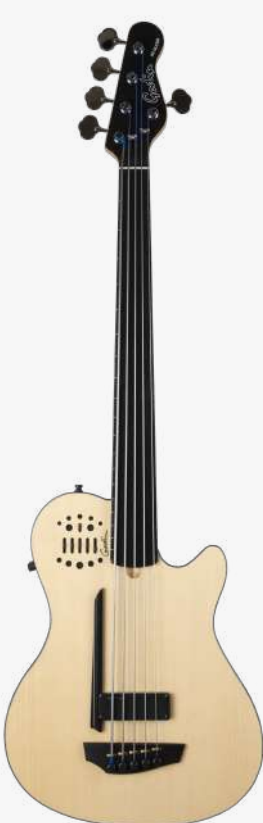
原木色 RN 050789