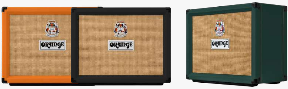
D-ROCKER-32 D-ROCKER-32-BK D-ROCKER-32-LTD-C

瓦数：15/30瓦 类别：双通道全电子管立体声 常规款喇叭：2×10 英寸“金标世界之声”扬声器 限量款喇叭：CELESTION 百变龙G10N-40扬声器 X2 清音通道控制：总音量 失真通道控制：增益，三段均衡，通道音量 输出功率：30瓦/15瓦 （立体声：15瓦×2 | 单声道：7.5瓦×2） 效果回路：电子管缓冲式 （支持单声道/立体声/湿干混合接入） 电子管矩阵：前级：4×ECC83/12AX7， 功放级：4×EL84，效果回路：2×ECC81/12AT7 颜色：橙/黑/墨绿 包装：1台/箱