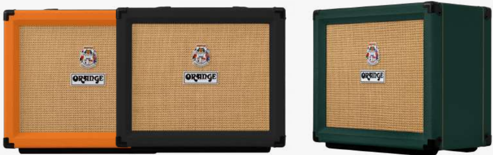
D-ROCKER-15 D-ROCKER-15-BK D-ROCKER-15-LTD-C

瓦数：0.5/1/7/15瓦 类别：双通道全电子管 常规款喇叭：1×10 英寸“金标世界之声”扬声器 限量款喇叭：CELESTION 百变龙G10N-40扬声器 清音通道控制：总音量 失真通道控制：增益，三段均衡，通道音量 电子管矩阵：前级：3×12AX7 后级：2×EL84 效果缓冲：1×12AT7 颜色：橙/黑/墨绿 包装：1台/箱