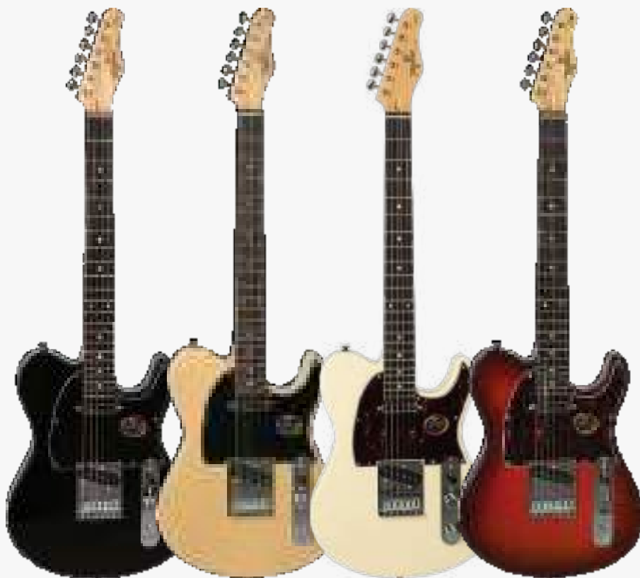
BK-DF/BK BS-DF/BK OWH-DF/TT HB-DF/TT