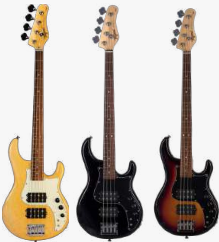
NT-DF/WV BK-DF/BK HB-DF/BK

琴体：巴西雪松木或巴西白木 琴颈：巴西象牙木 C型34” 有效弦长 14” 弧度半径 指板：22 品 巴西红檀木 上枕：牛骨 40MM（4弦）45MM（5弦） 电路：2 X TAGIMA MM铝镍钴 双线圈 拾音器 控制：2 音量、1 音色、2 串并联切换开关 琴桥：标准 HI-MASS 弦准：复古卷弦器 漆面：亮光 护板：黑色、白色 琴弦：DADDARIO 颜色：日落渐变、黑色、原木色 产地：巴西