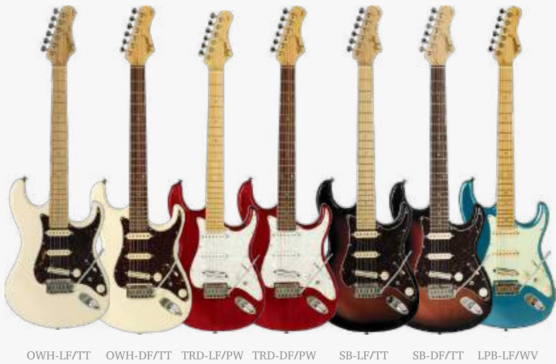
OWH-LF/TT OWH-DF/TT TRD-LF/PW TRD-DF/PW SB-LF/TT SB-DF/TT LPB-LF/WV

琴体：巴西雪松木 琴颈：巴西象牙木 C型25.5” 有效弦长 12” 弧度半径 指板：22品 巴西红檀木或者巴西象牙木 上枕：牛骨 43MM 电路：2 X TAGIMA BLUE 铝镍钴 单线圈 1 X HOTBUCKER 迷你 陶瓷 双线圈 控制：5 档切换、1 音量、1 音色、1切单 琴桥：两点式颤音琴桥 弦准：带弦锁的复古卷弦器 漆面：亮光 护板：玳瑁、冰花、薄荷绿 琴弦：DADDARIO 颜色：透明红、奥林匹克白、日落渐变、湖水蓝 产地：巴西