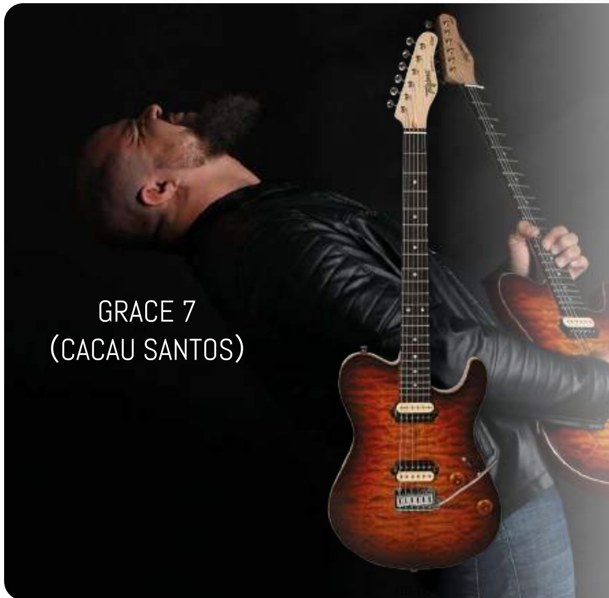
GRACE 7 (CACAU SANTOS)

贴面：精选奢华絮状枫木 琴体：桃花芯木（带声学腔体） 琴颈：枫木 C型25.5" 有效弦长 12" 弧度半径 指板：22品 乌木 品丝：不锈钢 上枕：牛骨 43MM 电路：2 X ZAGANIN CACAU SANTOS 签名款 斑马色 铝镍钴 双线圈 控制：5 档切换、1 音量、1 音色、1 串并联切换拨档 琴桥：GOTOH 510T FE-1 弦准：GOTOH SD91 MGT 漆面：亮光 护板：无 琴弦：DADDARIO 颜色：烈焰日落 产地：巴西