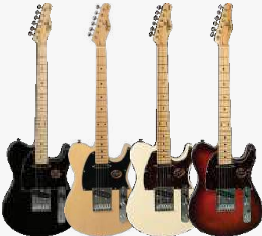
BK-LF/BK BS-LF/BK OWH-LF/TT HB-LF/TT

琴体：巴西雪松木 琴颈：巴西象牙木 C型25.5” 有效弦长 12” 弧度半径 指板：22品 巴西红檀木或者巴西象牙木 上枕：牛骨 43MM 电路：2 X TAGIMA BLUE 铝镍钴 单线圈 控制：3 档切换、1 音量、1 音色 琴桥：传统固定琴桥 弦准：复古卷弦器 漆面：亮光 护板：玳瑁、黑色 琴弦：DADDARIO 颜色：黑色、蜂蜜渐变、奶油糖色、奥林匹克白 产地：巴西