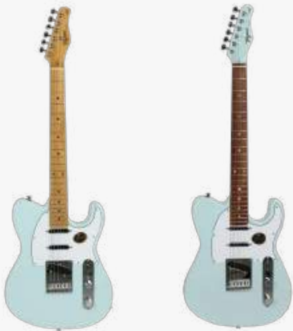
SBL LF/WH SBL DF/WH

琴体：巴西雪松木 琴颈：巴西象牙木 C型25.5” 有效弦长 12” 弧度半径 指板：22品 巴西红檀木或者巴西象牙木 上枕：牛骨 43MM 电路：2 X TAGIMA BLUE 铝镍钴 单线圈 1 X TAGIMA HOTBUCKER 迷你 陶瓷 双圈 控制：5 档切换、1 音量、1 音色、1切单 琴桥：传统固定琴桥 弦准：复古卷弦器 漆面：亮光 护板：白色 琴弦：DADDARIO 颜色：音速蓝 产地：巴西