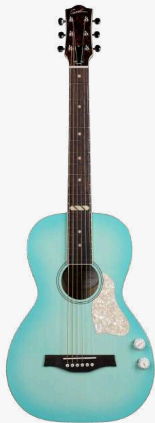
拉古纳蓝 RN 052707

琴型：PARLORL 圆角 面板：单板西提卡云杉 背侧：单板加拿大樱桃木 琴颈：桃花心木 24.84" 有效弦长 16" 指板弧度 1.72" 琴枕宽度 指板：19品 玫瑰木 12 品特殊品记镶嵌 琴枕：加拿大 GRAPHTECH 漆面：亮光 护板：冰花 旋钮：16:1 电路：EPM Q-离散 控制：1X音量，1X音色 琴桥：玫瑰木 琴弦：0.012 .016 0.024 0.032 0.042 0.053 配件：原厂琴包 产地：加拿大 *限量仅50把