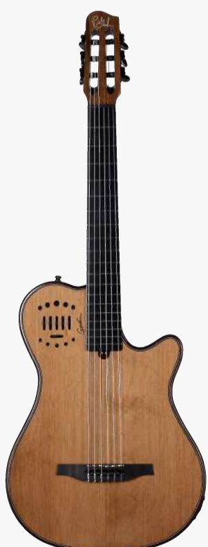
原木色 RN 053063

琴体：双腔体精选桃花心木（上下双层共鸣腔体） 面板：单板雪松面板 琴颈：桃花心木 25.6" 有效弦长 24" 指板弧度 2" 琴枕宽度 指板：19 品 RICHLITE 科技乌木指板 琴枕：加拿大 GRAPHTECH 漆面：亮光 旋钮：16:1 电路：GODIN & LR BAGGS 深度定制的豪华拾音器系统， 六个独立黄铜琴码压电拾音器，可与支持打板的 LYRIC 麦克风拾音器混合。可调节的带磁饱和， 以及模拟与相位控制，灵敏捕捉每一根琴弦的 微妙细节，可一键消除啸叫。 控制：拾音器前级控制位于面板之上，调节十分便捷。 琴桥：RICHLITE 科技乌木 琴弦：.0285 .0327 .0410 .030 .036 .044 HTC NYLON 配件：原厂琴包 产地：加拿大