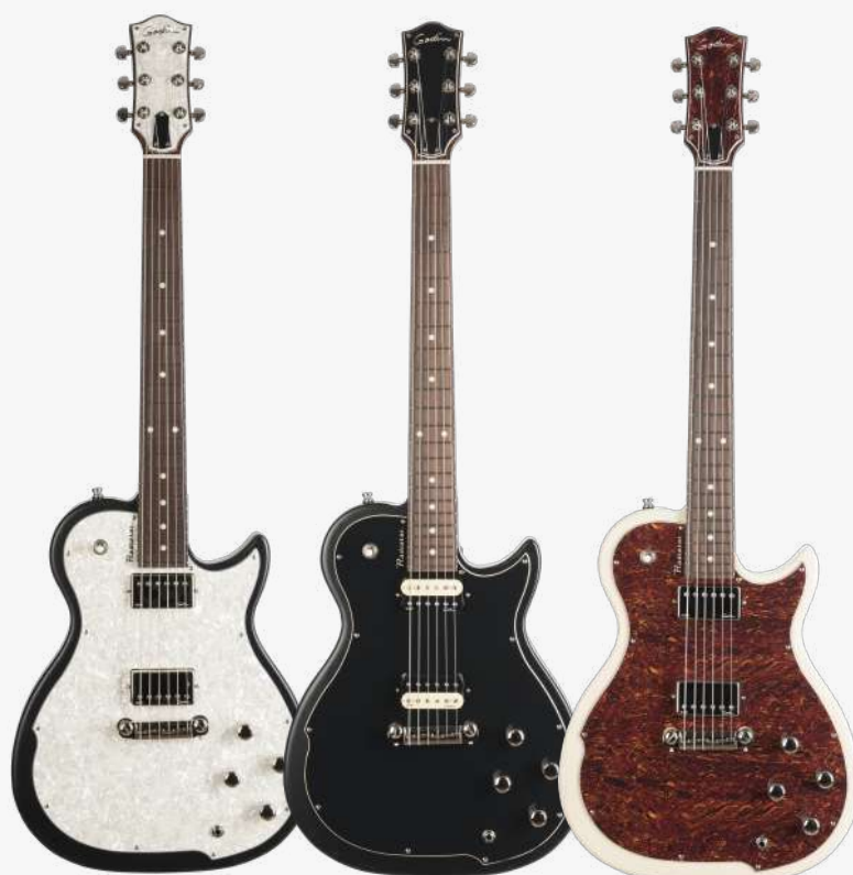
波旁渐变 RN 048465