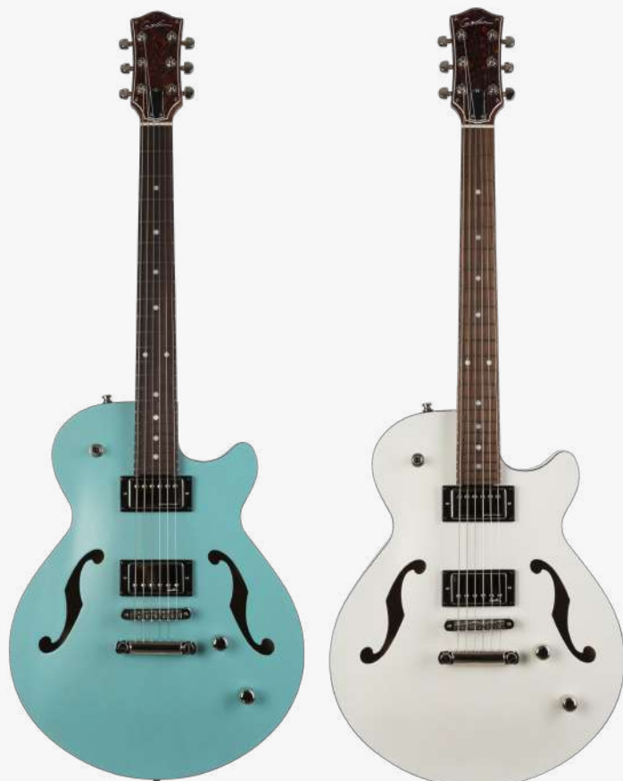
海湾蓝 RN 050215