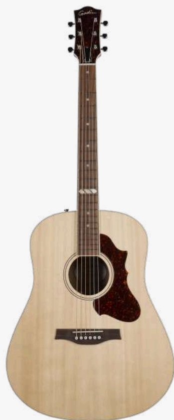
原木色 RN 051526

琴型：DREADNAUGHT 圆角 面板：单板西提卡云杉木 侧板：单板桃花心木 琴颈：桃花心木 25.5 " 有效弦长 16" 指板弧度 1.72" 琴枕宽度 指板：21 品 玫瑰木指板 12 品特殊品记镶嵌 琴枕：加拿大 GRAPHTECH 漆面：面板亮光 护板：玳瑁 旋钮：16:1 电路：FISHMAN SONITONE 拾音器 控制：1 音量、1 音色 琴桥：玫瑰木 琴弦：.012 .016 .024 .032 .042 .053 A6 LT 配件：无 产地：加拿大