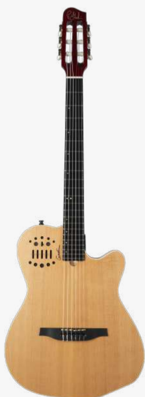
原木色 RN 032167

琴体：银叶枫木拼加拿大劳伦森椴木两翼 面板：单板雪松面板 琴颈：桃花心木 25.5" 有效弦长 16" 指板弧度 1.7" 琴枕宽度 指板：22 品 RICHLITE 科技乌木指板 琴枕：加拿大 GRAPHTECH 漆面：哑光 旋钮：16:1 电路：GODIN & LR BAGGS 深度定制的豪华拾音器系统， 六个独立黄铜琴码压电拾音器。 13 针接口用于 ROLAND GR 合成器和大多数 13 针 MIDI 设备，可让吉他发出其他乐器的音色。 控制：拾音器前级控制位于面板之上，调节十分便捷。 琴桥：RICHLITE 科技乌木 琴弦：.0285 .0327 .0410 .030 .036 .044 HTC NYLON 配件：原厂琴包 产地：加拿大