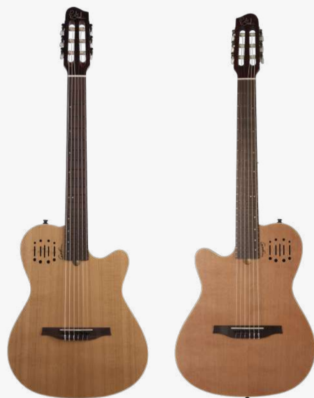
原木色 RN 035045