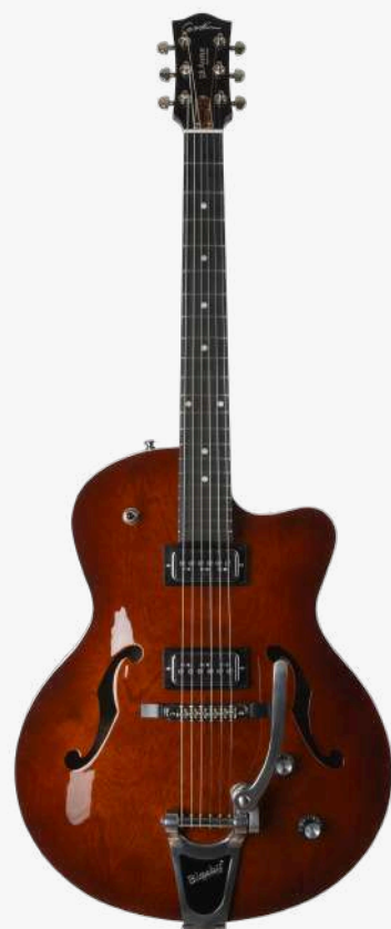
哈瓦那渐变 RN 050970

琴型：单缺角设计 琴体：加拿大樱桃木面、背、侧 琴颈：加拿大银叶枫木 24.84 " 有效弦长 16" 指板弧度 1.72" 琴枕宽度 指板：21 品 RICHLITE 科技乌木指板 琴枕：加拿大 GRAPHTECH 漆面：面板亮光 旋钮：低音弦 18:1 高音弦 26:1 镀铬卷弦器 电路：2 X T-ARMOND BY TV JONES (琴颈、琴桥) 控制：1 音量、1 音色、3 档旋钮切换 琴桥：TUNE-O-MATIC 滚珠琴桥、BIGSBY 颤音拉弦板 琴弦：.011 .014 .018 .028 .038 .049 D'ADDARIO EXL115 NICKEL WOUND 配件：无 产地：加拿大