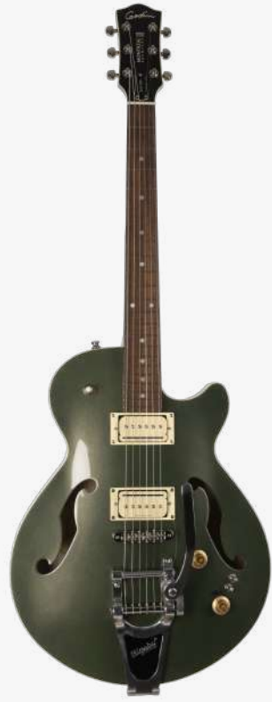
沙漠绿 RN 051588

琴型：单缺角设计 琴体：拱面开放气孔雪松木 背侧：加拿大樱桃木面板 琴颈：桃花心 24.75" 有效弦长 12" 指板弧度 1.68" 琴枕宽度 指板：22 品 玫瑰木 / 赛璐璐品记镶嵌 琴枕：加拿大 GRAPHTECH 漆面：亮光 旋钮：低音弦 18:1 高音弦 26:1 镀铬卷弦器 电路：2 X SEYMOUR DUNCAN P-RAIL (琴颈、琴桥) 控制：1 音色、1 音量、3 档控制、2 迷你拨档 琴桥：BIGSBY 颤音系统、滚珠琴桥 琴弦：.010 .013 .017 .026 .036 .046 E10 配件：原厂琴包 产地：加拿大