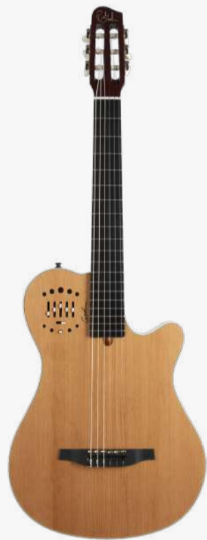
原木色 RN 049479

琴体：双腔体加拿大银叶枫木（上下双层共鸣腔体） 面板：单板雪松面板 琴颈：桃花心木 25.6" 有效弦长 24" 指板弧度 2" 琴枕宽度 指板：19 品 RICHLITE 科技乌木指板 琴枕：加拿大 GRAPHTECH 漆面：亮光 旋钮：16:1 电路：GODIN & LR BAGGS 深度定制的豪华拾音器系统， 六个独立黄铜琴码压电拾音器，可与支持打板的 LYRIC 麦克风拾音器混合。可调节的带磁饱和， 以及模拟与相位控制，灵敏捕捉每一根琴弦的微妙 细节，可一键消除啸叫。 控制：拾音器前级控制位于面板之上，调节十分便捷。 琴桥：RICHLITE 科技乌木 琴弦：.0285 .0327 .0410 .030 .036 .044 HTC NYLON 配件：原厂琴包 产地：加拿大