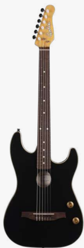
哑光黑 RN 051458

琴体：腔体加拿大银叶枫木 贴面：单板雪松面板 琴颈：硬石枫木 25.5" 有效弦长 12" 指板弧度 1.65" 琴枕宽度 指板：22 品 玫瑰木 中号品丝 琴枕：加拿大 GRAPHTECH 漆面：哑光 旋钮：14:1 电路：1 X EPM Q-DISCRETE 压电拾音器 控制：1 音量、1 音色 琴桥：玫瑰木 琴弦：.029 .0333 .0416 .030 .036 .045 XHTC 配件：原厂琴包 产地：加拿大