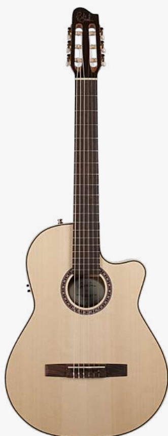
原木色 电箱 RN 051809

面板：单板云杉木 背板：单板桃花心木 琴颈：桃花心木 25.66 " 有效弦长 24" 指板弧度 2" 琴枕宽度 指板：19 品 玫瑰木 琴枕：加拿大 GRAPHTECH 漆面：亮光 旋钮：14:1 电路：FISHMAN CLASICA II 控制：1 音量、1 音色 琴桥：玫瑰木 琴弦：.0285 .0327 .0410 .030 .036 .044 HTC NYLON 配件：无 产地：加拿大