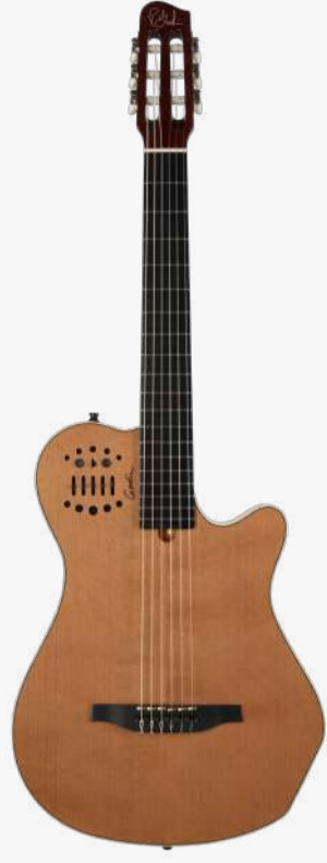
原木色 RN 012817