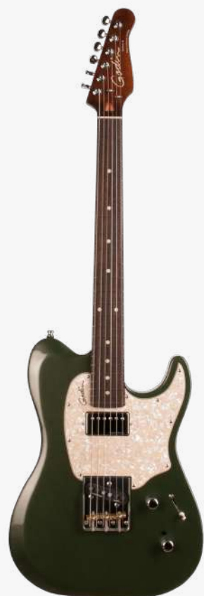
沙漠绿 RN 046959

琴体：加拿大劳伦森椴木 琴颈：硬枫木 25.5" 有效弦长 12" 指板弧度 1.65" 琴枕宽度 护板：五层冰花护板或玳瑁护板 指板：22 品 玫瑰木 琴枕：加拿大 GRAPHTECH 漆面：亮光 旋钮：18:1 电路：1 X SEYMOUR DUNCAN '59 双线圈拾音器（琴颈） 1 X GODIN CUSTOM CAJUN 单线圈拾音器（琴桥） 控制：1 音量、1 音色、5 档控制 1 X GODIN HDR 高解析度降噪系统 琴桥：CUSTOM T 可调节八度复古琴桥、黄铜琴鞍 琴弦：.010 .013 .017 .026 .036 .046 E10 配件：原厂琴包 产地：加拿大