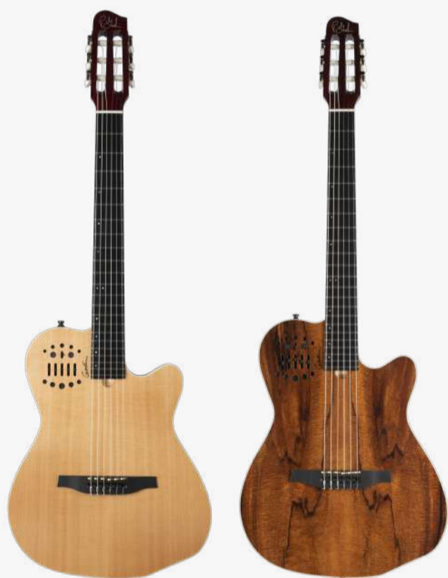
原木色 RN 032150