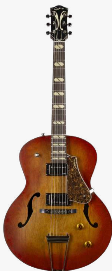
孟菲斯太阳 RN 051496

琴型：圆角设计 琴体：加拿大樱桃木面、背、侧 琴颈：加拿大银叶枫木 24.84 " 有效弦长 16" 指板弧度 1.72" 琴枕宽度 指板：21 品 玫瑰木 琴枕：加拿大 GRAPHTECH 漆面：19 世纪法式哑光漆面 护板：悬浮护板 旋钮：低音弦 18:1 高音弦 26:1 镀铬卷弦器 电路：1 X CUSTOM GODIN HB (琴颈) 1 X SEYMOUR DUNCAN ' 59 (琴桥) 控制：1 音量、1 音色、3 档控制 琴桥：加拿大 GRAPHTECH 可调节式 TUSQ 琴桥 带 TOM ROLLER SADDLES 和梯形拉弦板 琴弦：.012 .016 .024W .032 .042 .052 E12 JAZZ 配件：无 产地：加拿大