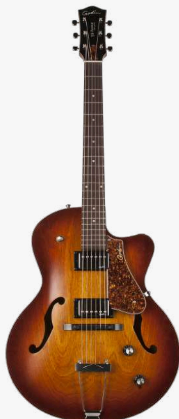
白兰地渐变 RN 050932

琴型：单缺角设计 琴体：加拿大樱桃木面、背、侧 琴颈：加拿大银叶枫木 24.84 " 有效弦长 16" 指板弧度 1.72" 琴枕宽度 指板：21 品 玫瑰木 琴枕：加拿大 GRAPHTECH 漆面：19 世纪法式哑光漆面 护板：悬浮护板 旋钮：低音弦 18:1 高音弦 26:1 镀铬卷弦器 电路：2 X CUSTOM GODIN HUMBUCKER (琴颈、琴桥) 控制：1 音量、1 音色、三档旋钮切换 琴桥：加拿大 GRAPHTECH 可调节式 TUSQ 琴桥 琴弦：.012 .016 .024W .032 .042 .052 E12 JAZZ 配件：无 产地：加拿大