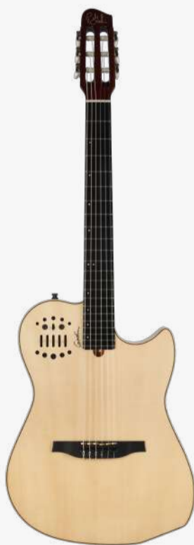
原木色 RN 004690

琴体：双腔体精选桃花心木（上下双层共鸣腔体） 面板：单板云杉面板 琴颈：桃花心木 25.5" 有效弦长 16" 指板弧度 1.9" 琴枕宽度 指板：22 品 RICHLITE 科技乌木指板 琴枕：加拿大 GRAPHTECH 漆面：亮光 旋钮：16:1 电路：GODIN & LR BAGGS 深度定制的豪华拾音器系统，六个独立黄铜琴码压电拾音器。 13 针接口用于 ROLAND GR 合成器和大多数 13 针 MIDI 设备，可让吉他发出其他乐器的音色。 控制：拾音器前级控制位于面板之上，调节十分便捷。 琴桥：RICHLITE 科技乌木 琴弦：.0285 .0327 .0410 .030 .036 .044 HTC NYLON 配件：原厂琴包 产地：加拿大