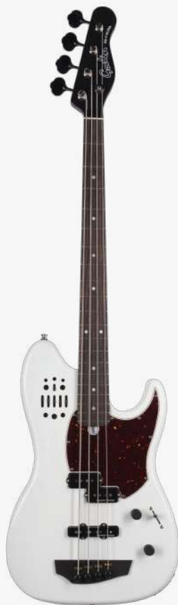
透明白 RN 050420

贴面：银叶枫木 琴体：带腔体加拿大劳伦森椴木 琴颈：硬石枫木 34" 有效弦长 12" 指板弧度 1.5" 琴枕宽度 指板：20 品 玫瑰木 琴枕：加拿大 GRAPHTECH 漆面：哑光 护板：5 层玳瑁护板 旋钮：20:1 电路：1 X SEYMOUR DUNCAN VINTAGE P-BASS (中间) 1 X SEYMOUR DUNCAN APOLLO J-BASS (琴桥) 1 X HEX ACOUSTIC SADDLES CUSTOM VOICED LR BAGGS 前级 可混合音量、模拟磁饱和度音色调节、 FAT 控制，高音、中音、低音调节。 控制：1 音量、1 音色、4 档控制 琴桥：乌木 琴弦：.045 .065 .085 .105 D'ADDARIO EXL165 SUPER LONG SCALE 配件：原厂琴包 产地：加拿大