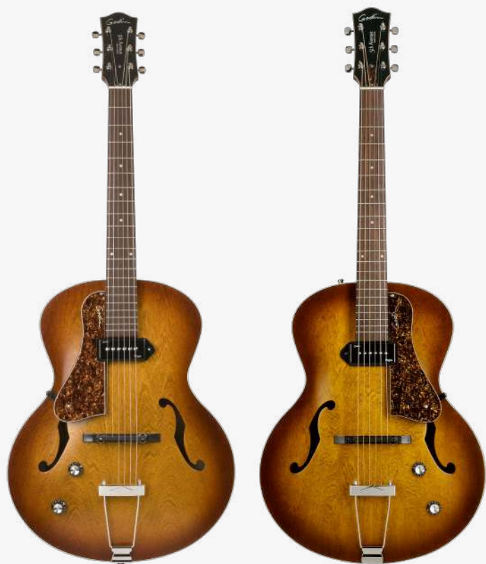
白兰地渐变 左手 RN 037728