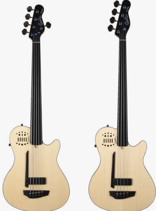
原木色 RN 050789