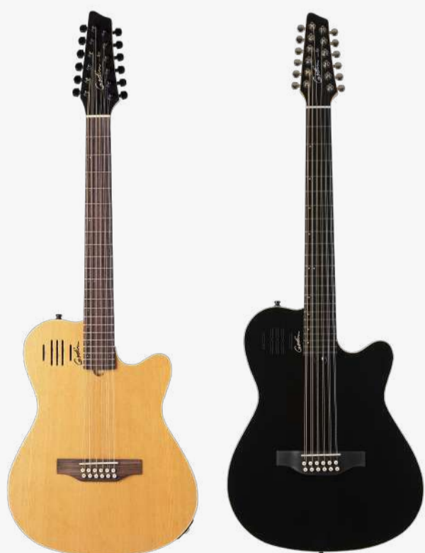
原木色 RN 025343