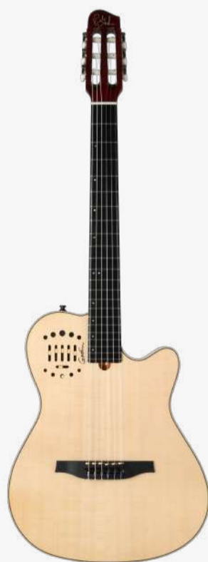
原木色 RN 050925