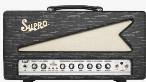
1932RH ROYALE HEAD 箱头

瓦数：50W 面板材质：亚麻镶金线 控制：音量、推子、高频、中频、低频、 混响深度、混响大小、总音量控制 效果：混响 FX LOOP BOOST 输入：1 喇叭接口：1X16欧, 2X8欧, 2X4欧 前级管：3X12AX7, 1X12AT7, 1X12DW7 后级管：2X5881