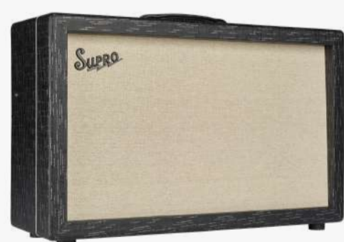
1933R* ROYALE 2X12

瓦数：35W / 50W (可切换) 电路：CLASS A/AB 喇叭：2XSUPRD BD12 控制：音量，推子，高频，中频，低频，混响深度 混响大小，总音量控制 效果：混响 FX LOOP BOOST 输入：1 喇叭接口：1X16欧、2X 8欧、2X 4欧 前级管：3X12AX7、1X12AT7、1X 120W7 后级管：2X5881