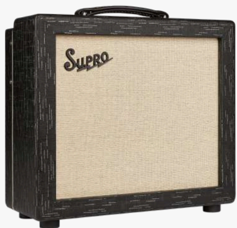
1612 RT AMULET 1X10

瓦数：1W / 5W / 15W (可切换) 电路：CLASS A 喇叭：1X百变龙10寸奶背 控制：音量，高频，低频，混响，颤音速度 颤音深度，总音量控制，瓦数切换 效果：混响、颤音 输入：1 喇叭接口：2X8欧 前级管：3X12AX7、1X12AT7 后级管：1X6L6