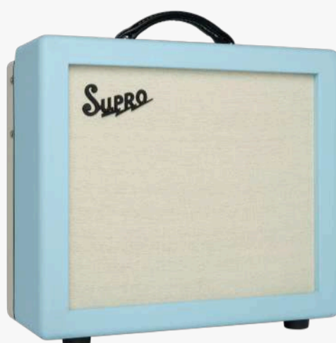
1614 RT AMULET 1X12

瓦数：1W / 5W / 15W (可切换) 电路：CLASS A 喇叭：1X百变龙12寸奶背 控制：音量，高频，低频，混响，颤音速度 颤音深度，总音量控制，瓦数切换 效果：混响、颤音 输入：1 喇叭接口：2X8欧 前级管：3X12AX7、1X12AT7 后级管：1X6L6