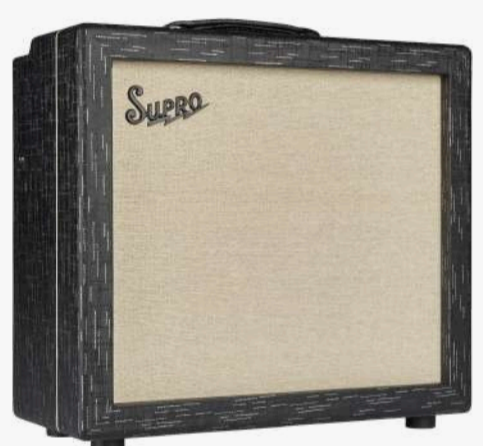
1932R* ROYALE 1X12

瓦数：35W / 50W (可切换) 电路：CLASS A/AB 喇叭：1XSUPRD BD12 控制：音量，推子，高频，中频，低频，混响深度 混响大小，总音量控制 效果：混响 FX LOOP BOOST 输入：1 喇叭接口：1X16欧、2X 8欧、2X 4欧 前级管：3X12AX7、1X12AT7、1X 120W7 后级管：2X5881